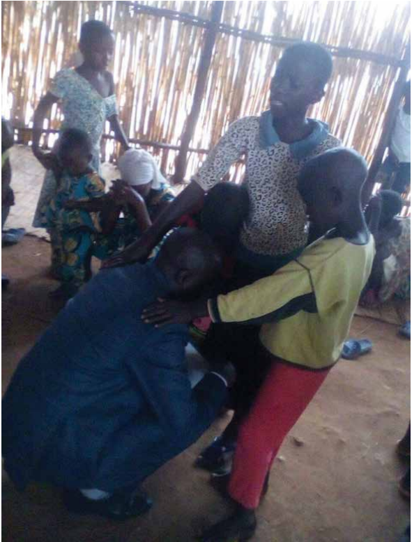
Bénédition en Afrique Centrale. Des enfants bénissant leurs parents, des parents bénissant leurs enfants, des maris et leurs épouses se bénissant l'un l'autre.